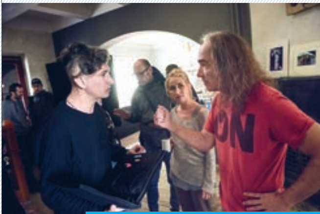
Režisér a ústrední herci pri nakrúcaní Pivnice.