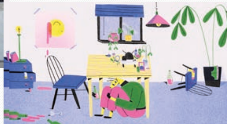
Sh_t Happens —