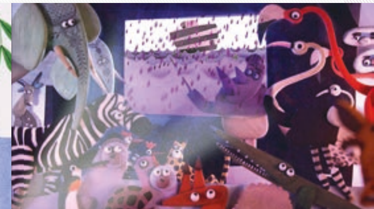
Cez palubu! —