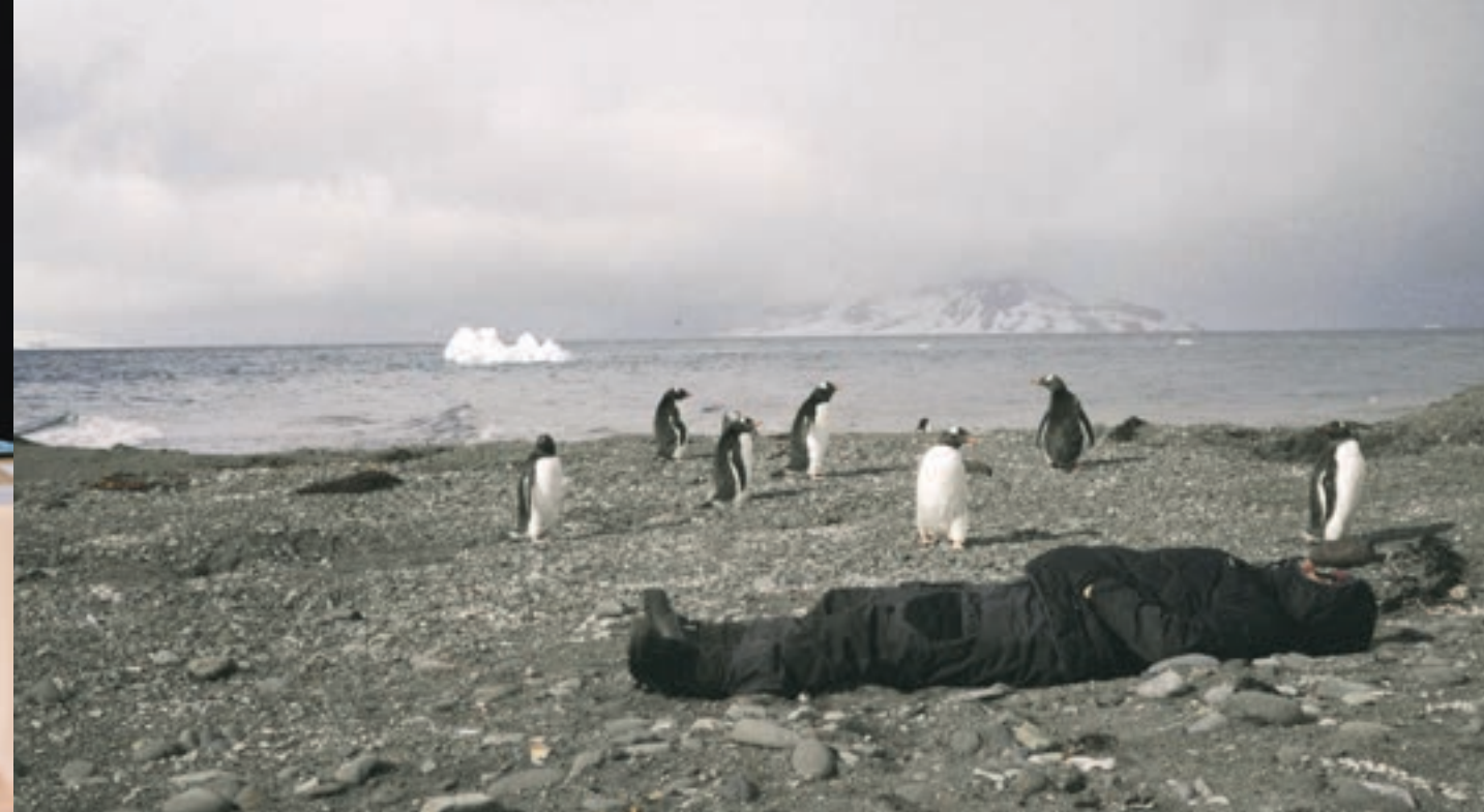
Biela na bielej —