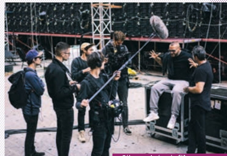
— Záber z nakrúcania filmu