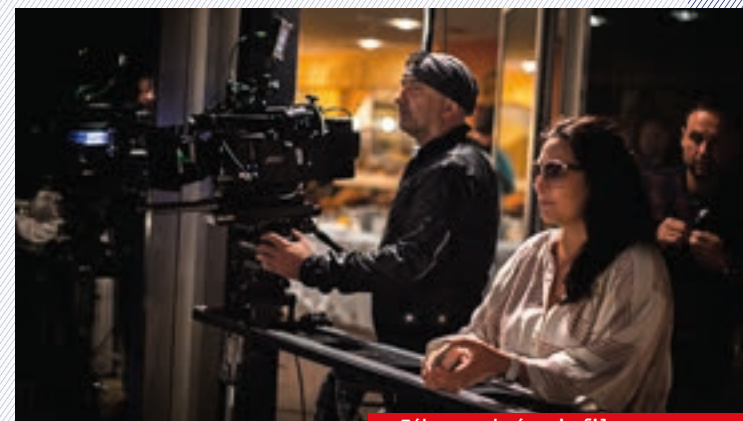
— Záber z nakrúcania filmu