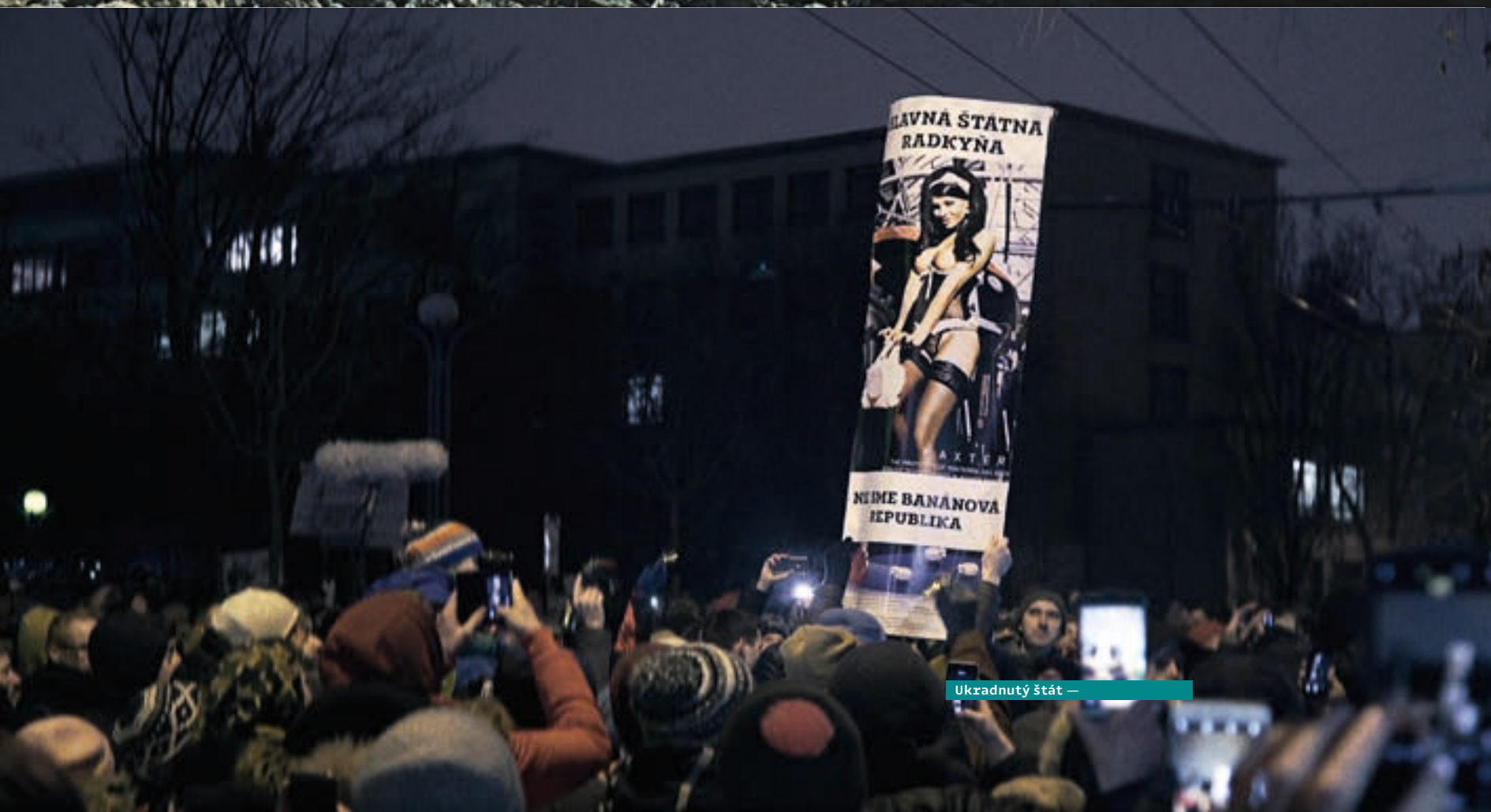
Ukzadnutý štát —

— text: Erik Binder / filmový publicista — foto: Filmtopia, D1 film, partizanfilm, K2 Studio —