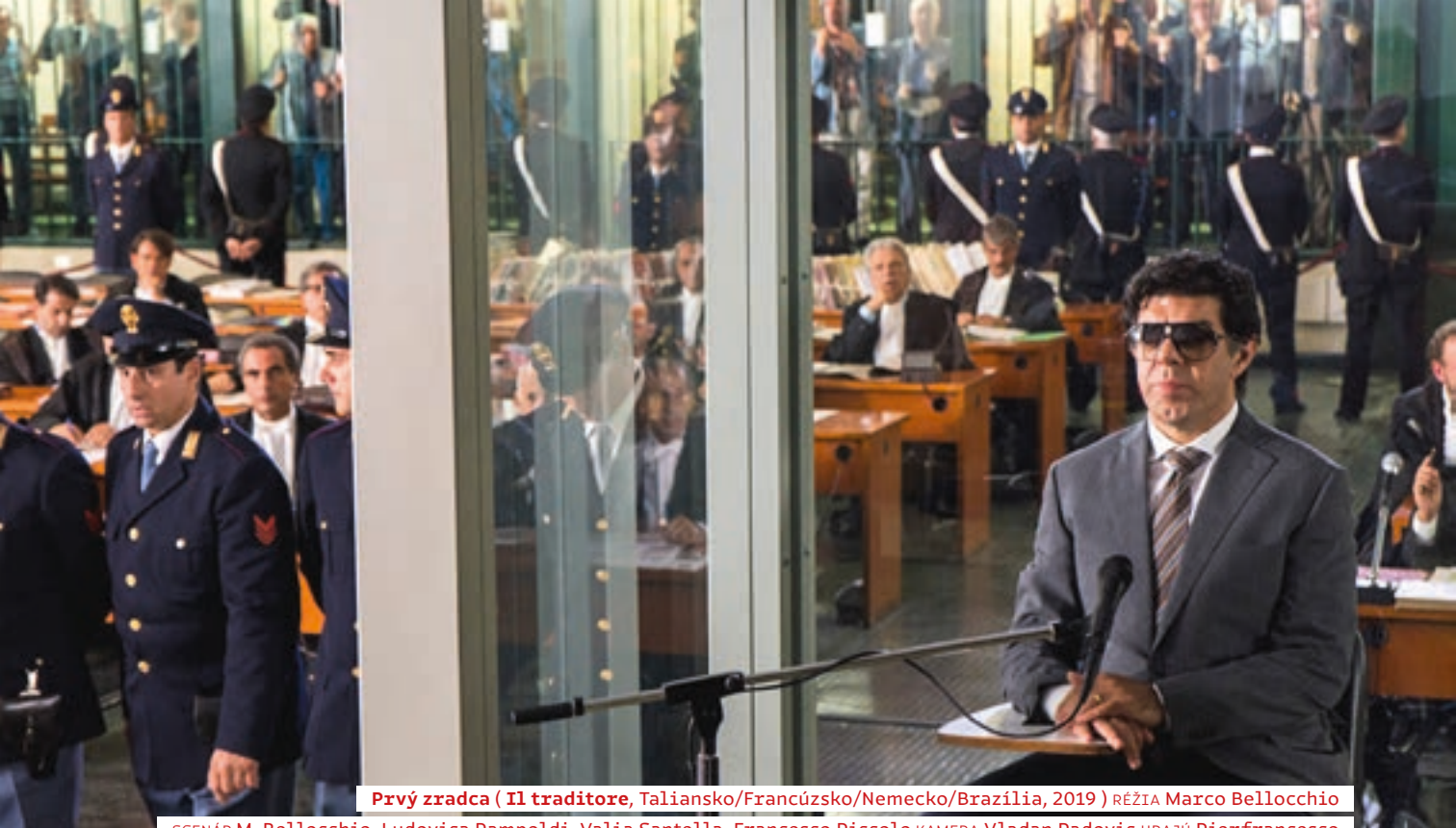
Prvý zradca (Il traditore, Taliansko/Francúzsko/Nemecko/Brazília, 2019) RÉŽIA Marco Bellocchio