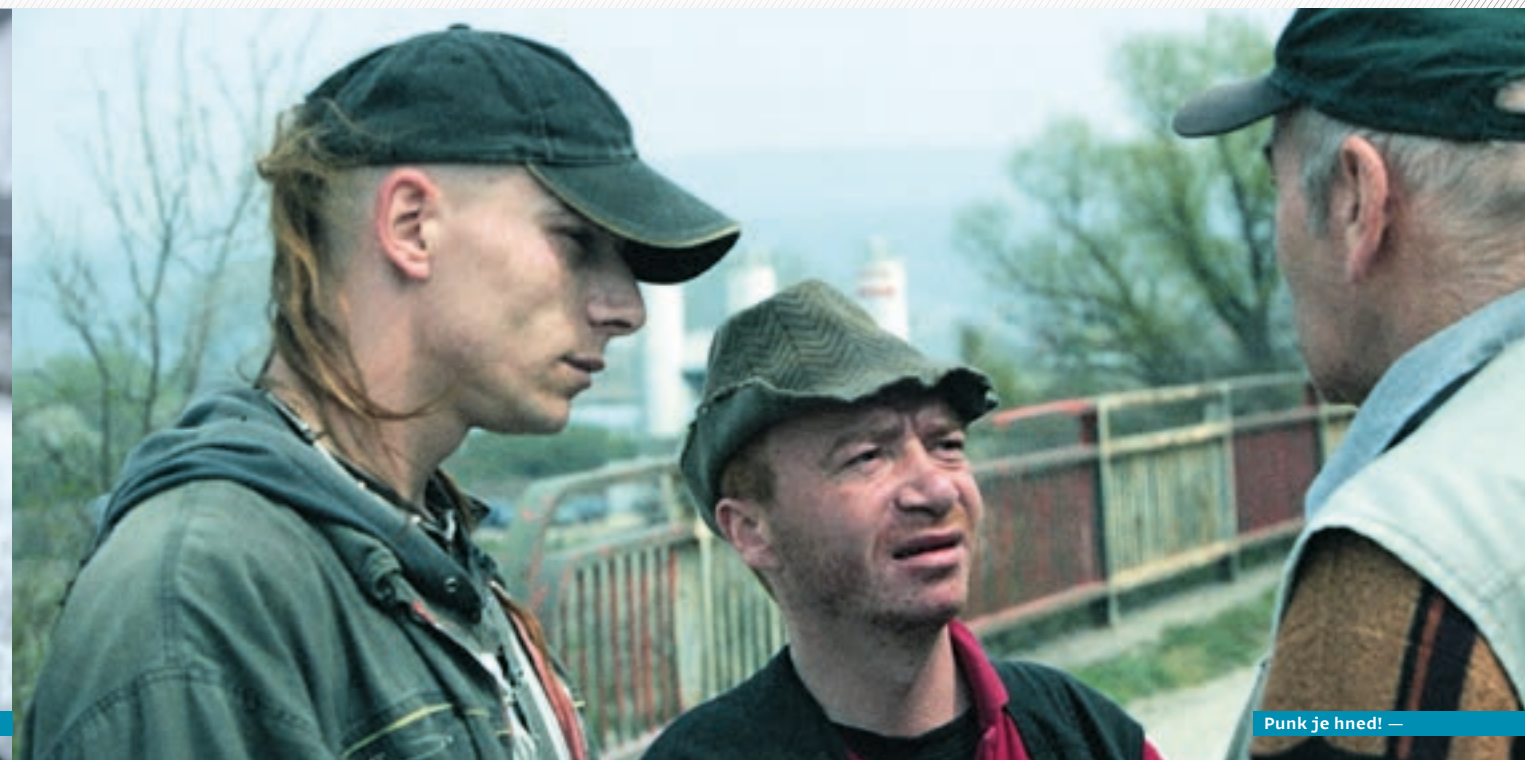
Punk je hned! —