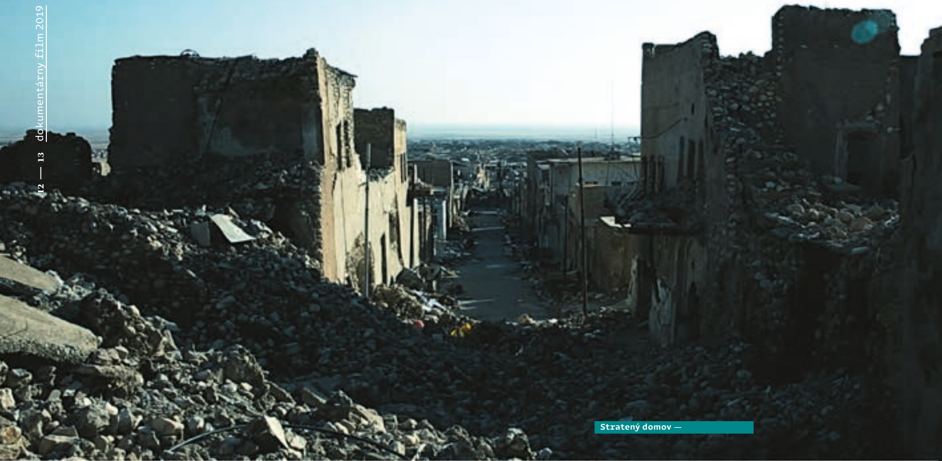
Stratený domov —