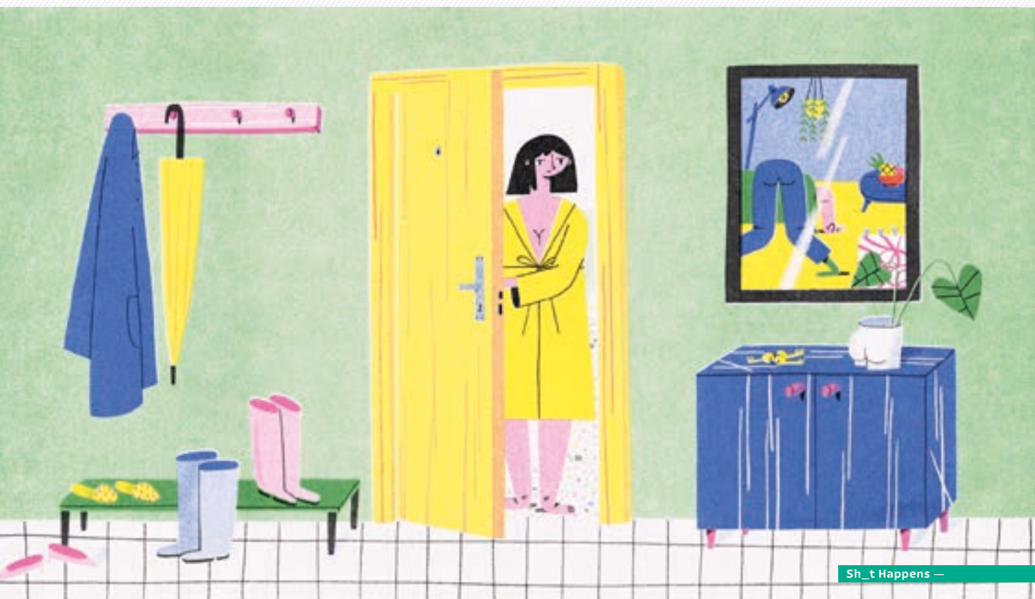
Sh_t Happens —