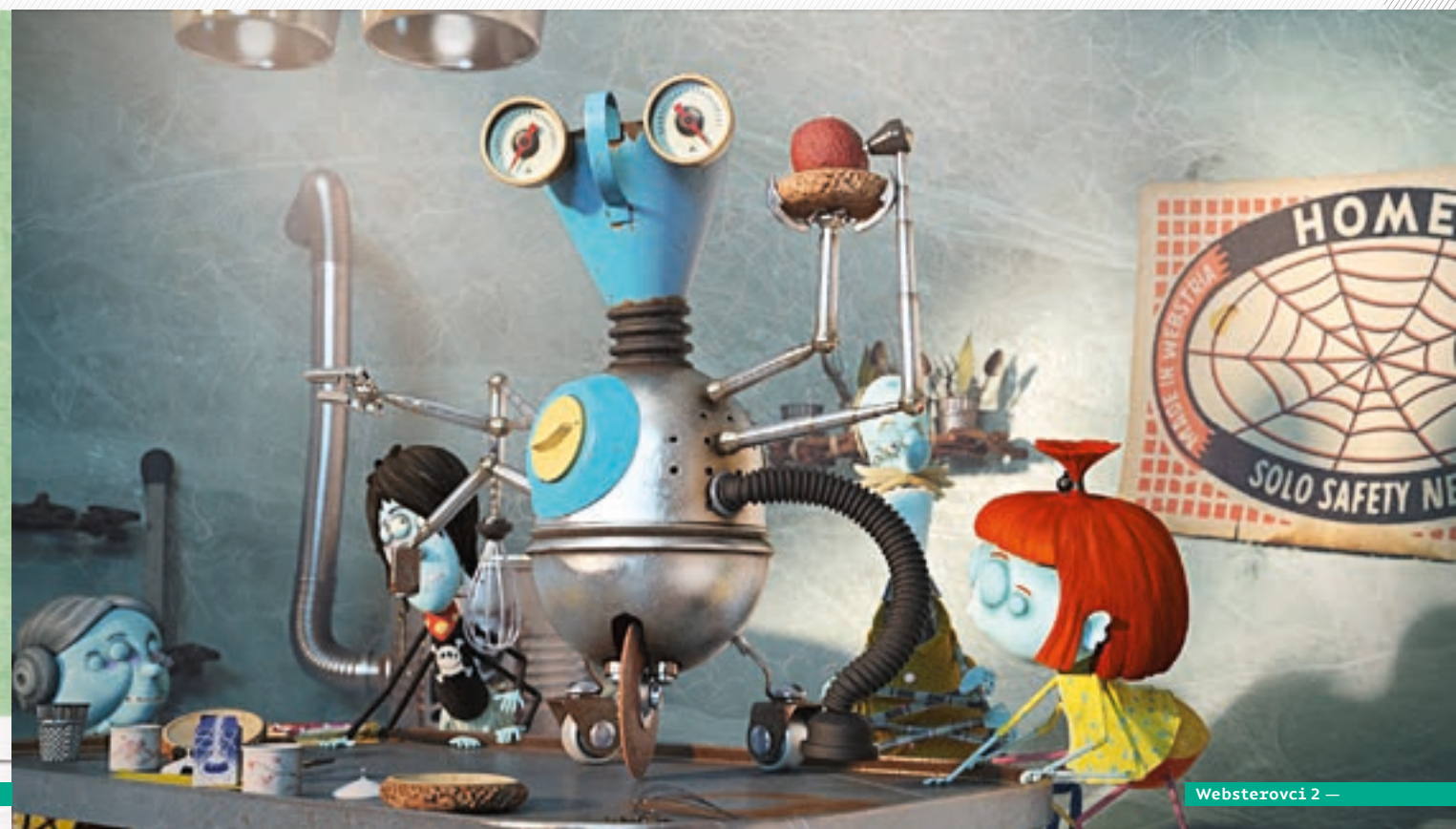
Websterovci 2 —