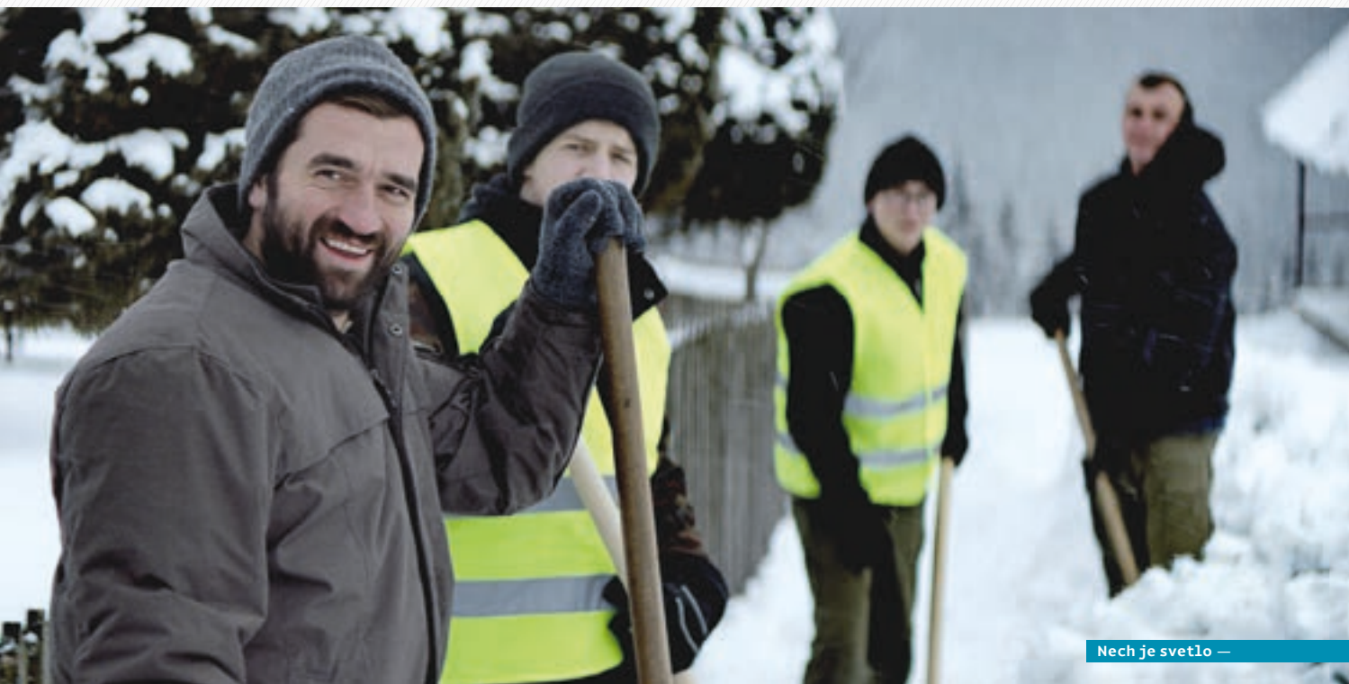
Nech je svetlo —

Silnú programovú opozíciu týchto snímok tvorí „živočíchopis“ filmov Punk je hned! a Hluché dni (druhý z nich je akýmsi náprotivkom Slepých lások ). Sú ukážkou zaujatého vzťahu ku skutočnosti, ktorá podmieňuje ich fabulu a bráni autentickosť pred nadradenými konštrukciami a vonkajšími intervenciami. Filmy približujú pos-