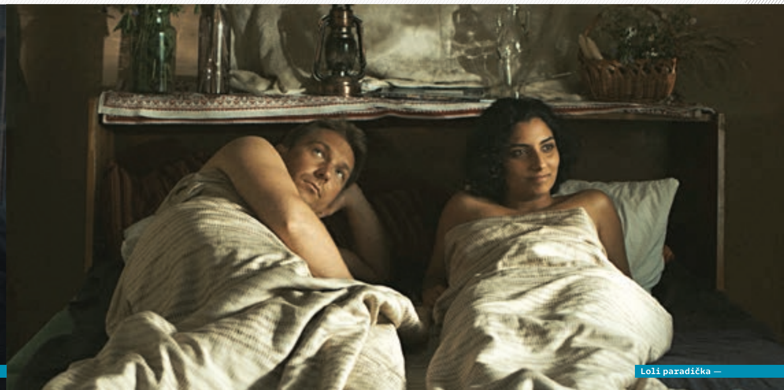
Loli paradicka —

lahodnosť výstižných dialógov, dôverná spätosť postáv s prostredím, vsadenie magickej línie do jarmočného podnikateľského priestoru vytvorili základňu na jedinečné zrážky naivity so skepsou a fanfarónstvom s uzvatosťou, znásobené krutým víťazstvom zvodcu pokušíteľa. Karavan s Rómkou, ktorú jej vlastní na konci filmu unášajú na prostitúciu do zahraničia, tiahne dialnicou v roztvorenej metafore utajeného násilia ďalších takýchto anonymných transportov v našej blízkosti. Loli paradicka vytvára bohatý priestor aj okolo vystaveného korpusu. Drsný koniec filmu ozrejmí, že rodičia mladej Rómky, spomínaní v replikách, naliehali na jej sobáš s vybraným ženíchom aj kvôli ochrane pred jej dôverčivosťou voči rómskym kriminálnikom. Záverečné precitnutie dievčiny z naivity otvára úvahy o možnostiach vymanenia z otrockého zajatia – či to zlé strašidlo, ktoré rituálne