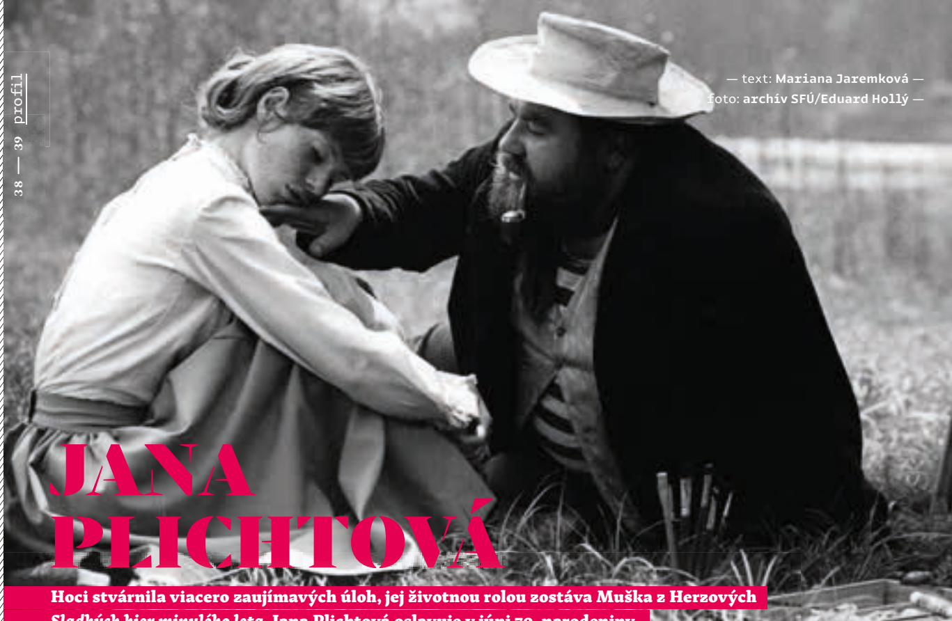
— text: Mariana Jaremková —