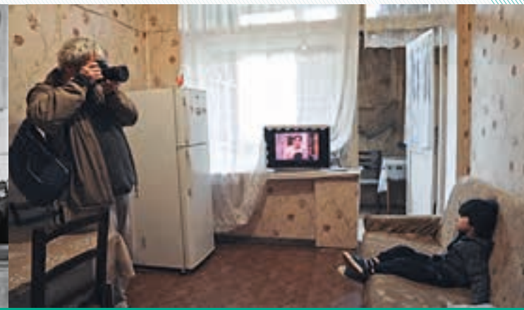
Raj na zemi —

päť rokov a potom takto prísť o finálnu fázu jeho uvedenia do sveta a k ľuďom,“ dodáva producentka.