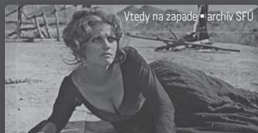
Vtedy na západe •

A na záver odporučím snímku, na ktorú by som bez zaváhania zašiel do kina a znova ju obdivoval vždy a všade, pretože ju nejde dosť milovať: Vtedy na západe (r. Sergio Leone, 1968). ▲