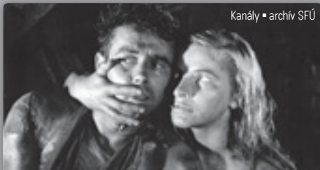
Kanály